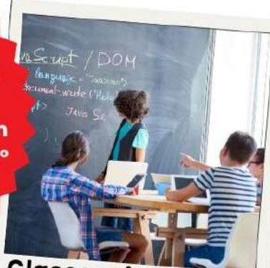
Clases orientadas al uso de la lengua y a la participación de los alumnos

Posibilidad de intercambio-movilidad de larga duración con el instituto francés con Évreux y Nancy en 4º de la ESO y 1º de Bachillerato