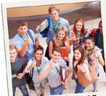
Podrás hacer nuevos amigos...