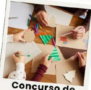
Concurso de postales navideñas