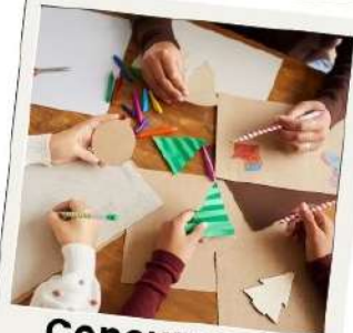
Concurso de postales navideñas