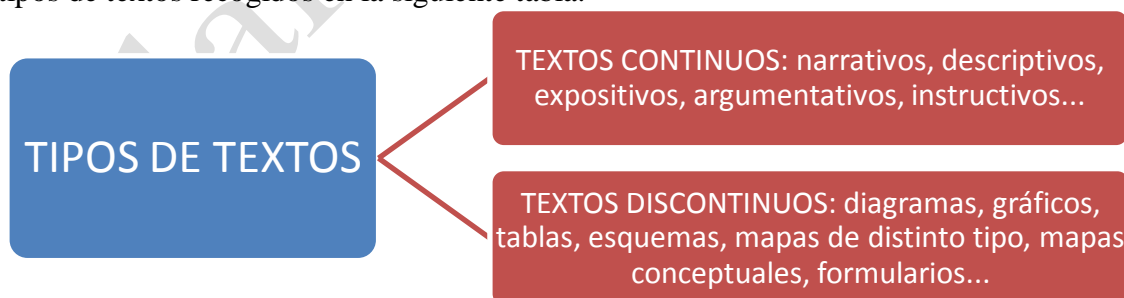
Fig. 1: Tipos de textos

Debe procurarse, igualmente, trabajar un ejemplo de cada uno de los distintos tipos de textos recogidos en la siguiente tabla: