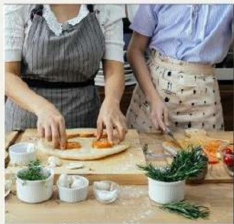
Concurso gastronómico de recetas francesas