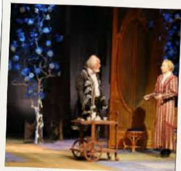
Asistencia al teatro en francés