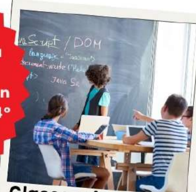
Clases orientadas al uso de la lengua y a la participación de los alumnos

Posibilidad de intercambio- movilidad de larga duración con el instituto francés con Évreux y Nancy en 4º de la ESO y 1º de Bachillerato