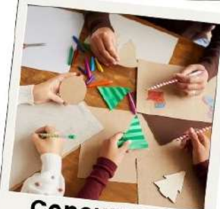
Concurso de postales navideñas