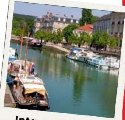
Intercambio con Verdún en 3º de la ESO