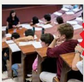
Materia presente en las pruebas de acceso a la universidad

Posibilidad de intercambio- movilidad de larga duración con el instituto francés con Évreux y Nancy en 4º de la ESO y 1º de Bachillerato